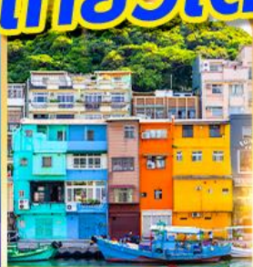
หมู่บ้านประมงเจินปิง

พักซีเหมินติง 2 คืน เที่ยวเต็ม!! ไม่มีวันอิสระ