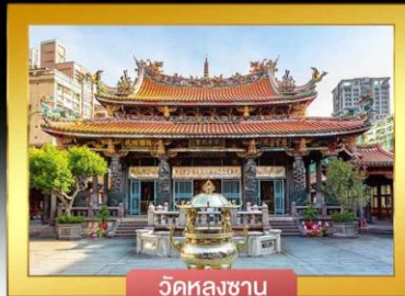
วัดหลงชาน