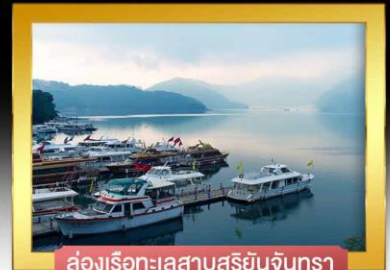
ล้องเรือทะเลสาบสุริยัันจันทรา