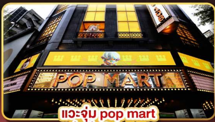
แวะช้อปปิ้ง pop mart ที่ฮิตที่สุดในซีเหมินติง