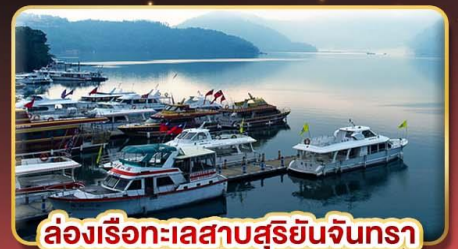
ล่องเรือทะเลสาบสุริยจันทร์