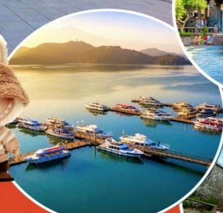
ทะเลสาบสุริยขึ้นจันทรา