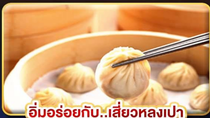
อิ่มอร่อยกับ...เสี่ยวหลงเปา

พิเศษ !! หม้อหนึ่งจักรพรรดิ ,ไอศกรีม MIYAHARA