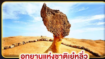
อุทยานแห่งชาติยี่หลิว