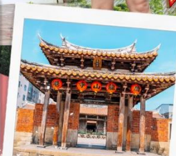
วัดหลงซาน