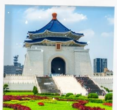
อนุสรณ์สถาน เจียงไคเชก