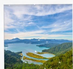
ทะเลสาบสุริยันจันทรา