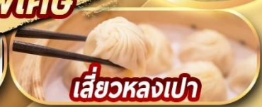
เสี่ยวหลงเปา

***ราคาขายเป็นราคาโปรโมชั่นไม่มีราคาเด็ก***