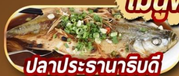
ปลาประรานาธิบดี