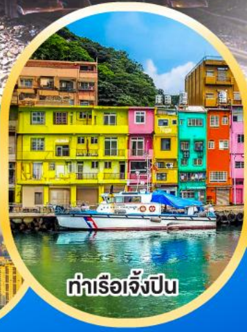
ท่าเรือเจิ้งปิน