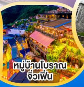
หมู่บ้านโบราณ จิวเฟิน