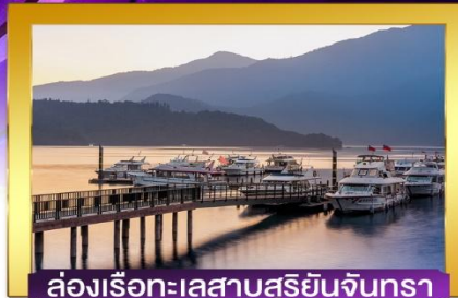
ล่องเรือทะเลสาบสุริยอันจินตรา