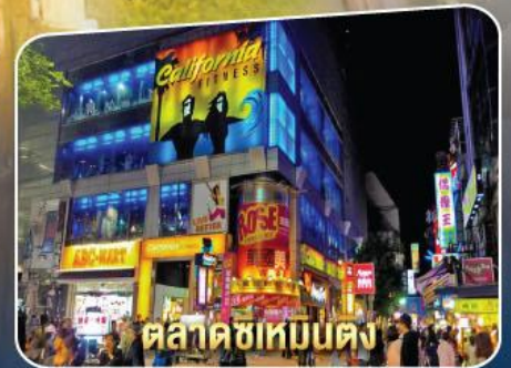
ตลาดซีเหมินตง

เมนูพิเศษ ! Buffet Shabu, Taiwan Seafood