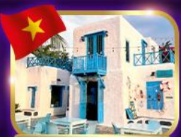
คาเฟ่สุดชิค ซานทรา มาริน่า