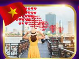
เช็คอินสะพานแห่งความรัก