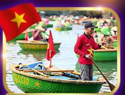
เรือกระด้ง หมู่บ้านกัมทาน