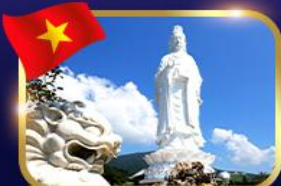
ขอมพรองค์กวนอิม วัดหลินอึ้ง