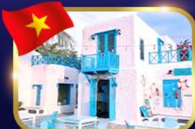
คาเฟ่สไตล์ซานโตรินี่ ชันตรา มารีน่า