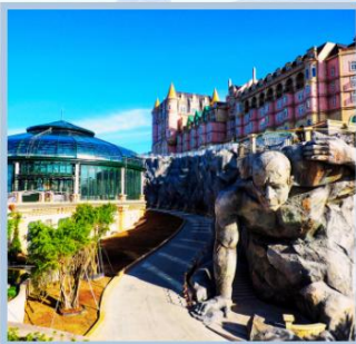
โซน Eclipse Square