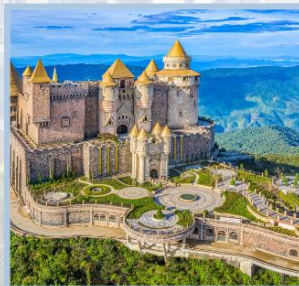
ปราสาทจินตรา