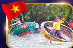
ล่องเรือกระดิว หมู่บ้านกิมทาน