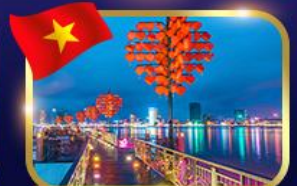
สะพานแห่งความรัก ดานัง