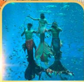
อควาเรียม