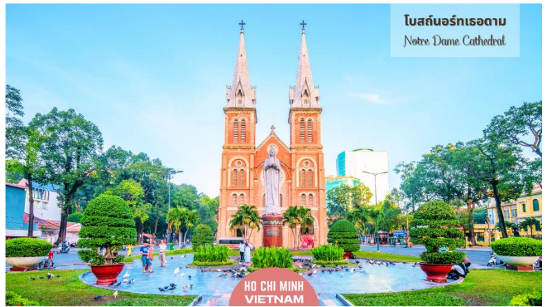
โบสถ์นอร์ทเทออดาน Notre Dame Cathedral

นำท่านถ่ายรูป มหาวิหารนอร์ทเทออร์ตาม เป็นอัญมณีทางสถาปัตยกรรมอันงดงามที่มีความสำคัญทางประวัติศาสตร์และวัฒนธรรม วิหารแห่งนี้สร้างขึ้นในยุคอาณานิคมฝรั่งเศส และเป็นสัญลักษณ์ของมรดกอันมั่งคั่งและความศรัทธาอันยาวนานของชาวเมืองไซงอน วัสดุที่ใช้ก่อสร้างล้วนนำเข้ามาจากฝรั่งเศส เป็นการผสมผสานอิทธิพลระหว่างยุโรปและเวียดนามอย่างลงตัว ความสมบูรณ์ของโครงสร้างเป็นข้อพิสูจน์ถึงคุณภาพของวัสดุเหล่านี้ รวมถึงอิฐสีแดงที่แข็งแรงในส่วนหน้าของอาคารซึ่งมีความวิจิตรสวยงาม และยอดแหลมที่สูงตระหง่าน ภายในวิหารยังได้รับการออกแบบให้รองรับผู้คนที่ได้ประมาณ 1,200 คน