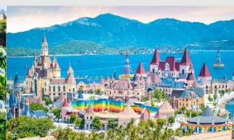
VinWonders NHA TRANG