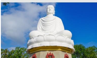
วัดลองเซิน