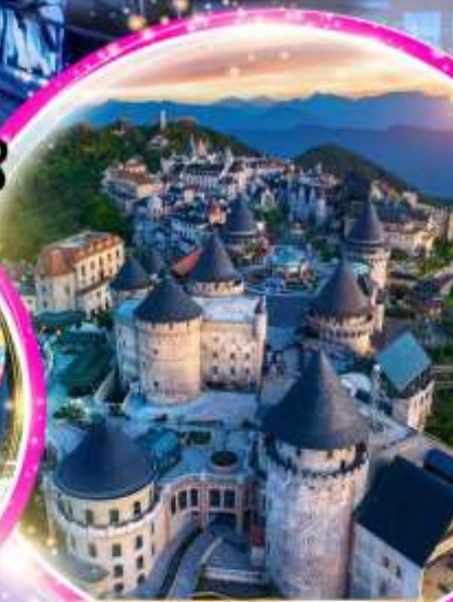
Ba Na Hills