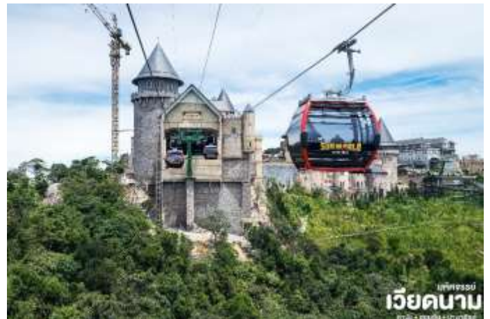
บึงจรรย์ เวียดนาม คานิง • ฮอยอัน • บานาฮิลล์

นั่งกระเช้าขึ้นสู่บานาฮิลล์ กระเช้าแห่งบานาฮิลล์นี้ได้รับการบันทึกสถิติโลกโดย World Record ว่าเป็นกระเช้าไฟฟ้าที่ยาวที่สุดประเภท Non Stop โดยไม่หยุดแะมีความยาวทั้งสิ้น 5,042 เมตรและเป็นกระเช้าที่สูงที่สุดที่ 1,294 เมตร นักท่องเที่ยวจะได้สัมผัสปุยมะหมอกและบางจุดมีเมฆลอยต่ำกว่ากระเช้า