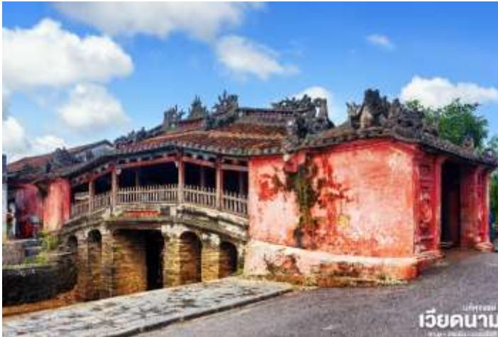
เวียดนาม