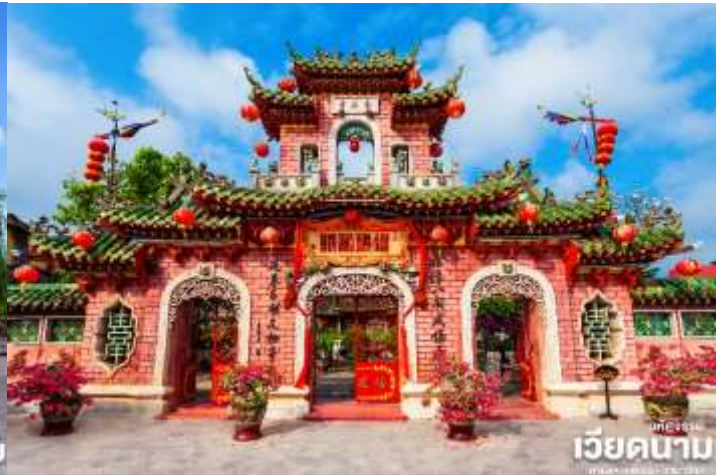
เวียดนาม