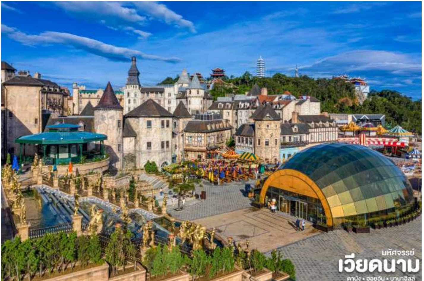
บึงจรรย์ เวียดนาม คานิง • ฮอยอัน • บานาฮิลล์