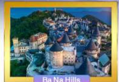
Ba Na Hills