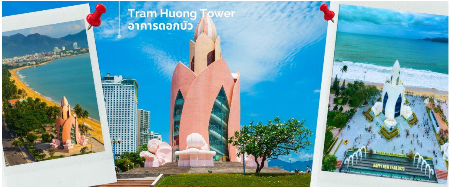
Tram Huong Tower อาคารดอกบัว

นำท่านชม ชายหาดเมืองญาจาง และ Tram Huong Tower อาคารดอกบัว เป็นสัญลักษณ์ของเมืองญาจาง ซึ่งมีสวนส่งเสริมภาพลักษณ์ของเมืองชายฝั่งให้กับนักท่องเที่ยวทั้งในและต่างประเทศ ตัวอาคารมีจุดเด่นเป็นสถาปัตยกรรมจำลองรูปทรงดอกบัวที่สวยงาม เป็นอีกหนึ่งแลนด์มาร์คที่อยู่บนหาดญาจาง