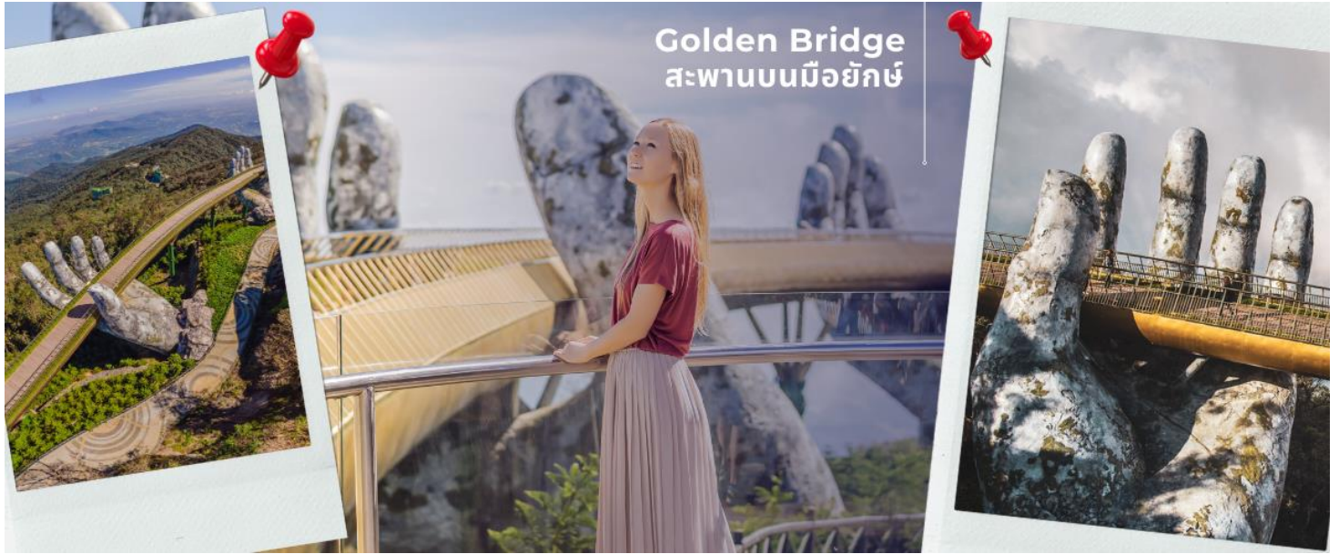
Golden Bridge สะพานบนมือยักษ์

เที่ยง รับประทานอาหารเที่ยง ณ ภัตตาคาร (4) จากนั้นนำท่านผ่านชม ภูเขาหินอ่อน Marble Mountains และนำท่านเข้าชม หมู่บ้านแกะสลักหินอ่อน ที่มีแหล่งวัตถุดิบหินอ่อนเนื้อดี และช่างแกะสลักฝีมือประณีต ส่งออกจำหน่าย ทั่วโลก จากนั้นนำท่านเดินทางสู่