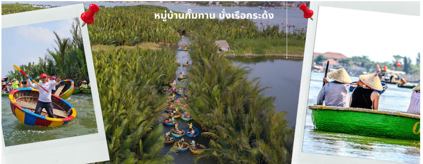
หมู่บ้านก๊มทาบ บั้งเรือกระดัง

เที่ยง รับประทานอาหารเที่ยง ณ ภัตตาคาร (4) จากนั้นนำท่านผ่านชม ภูเขาหินอ่อน Marble Mountains และนำท่านเข้าชม หมู่บ้านแกะสลักหินอ่อน ที่มีแหล่งวัตถุดิบหินอ่อนเนื้อดี และช่างแกะสลักฝีมือประณีต ส่งออกจำหน่าย ทั่วโลก จากนั้นนำท่านเดินทางสู่