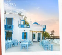
ซานตารีน้ำกาแฟ