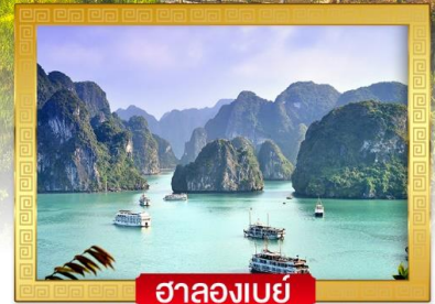
ฮาลองเบย์