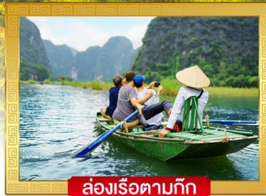
ล่องเรือตามก๊ก