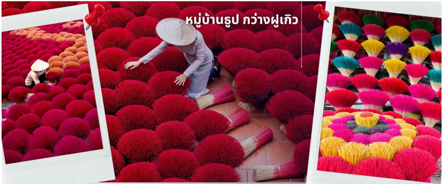
หมู่บ้านรูป กวางฝูเกิว

ดึงดูดนักท่องเที่ยวให้ไปเยี่ยมชม เรียกได้ว่า เป็นแลนด์มาร์คใหม่ของนักท่องเที่ยวเลยทีเดียวสลับซับซ้อนราวกับภาพสามมิติ