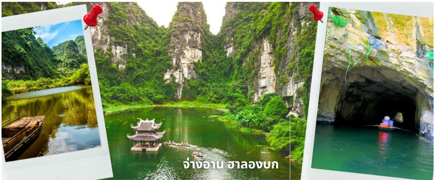
จ่างอาน ฮาลองบก

จากนั้นนำท่านเดินทางสู่ จ่างอาน เป็นพื้นที่ที่มีทั้งภูมิทัศน์อันงดงามของยอดเขาหินปูนแม่น้ำหลายสายไหลลัดเลาะ บางส่วนจมอยู่ใต้น้ำ และยังถูกล้อมรอบด้วยผาสูงชัน จึงทำให้สถานที่แห่งหนึ่งงดงามน่าชมการขึ้นชมทัศนียภาพที่สวยงามในจ่างอานนั้น คือการล่องเรือเล็กประมาณลำละ 4-5 คนเพื่อเข้าไปเยี่ยมชมจ่างอานเรือแจวก็จะพาเราไปเยี่ยมชมวัด หลังจากนั้นก็จะพาเราไปลอดถ้ำ มีทั้งหมด 49 ถ้ำ ซึ่งแต่ละถ้ำจะมีชื่อแตกต่างกันไปจะใช้เวลาล่องเรือไปกลับร่วมสองชั่วโมงเลย ที่เดียว จ่างอานยังถูกเรียกว่า ฮาลองบก เพราะที่นี่มีเขาหินปูนและถ้ำคล้ายกับที่อ่าวฮาลอง