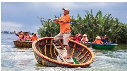
เรือกระดง