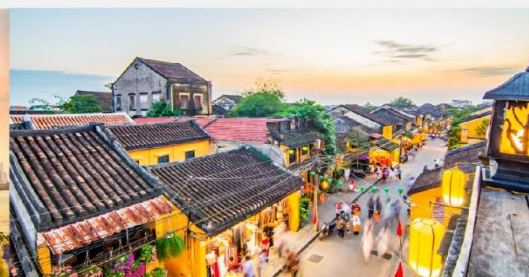
หมู่บ้านฮอยอัน