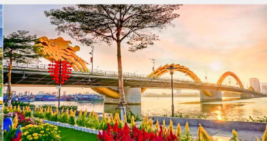
สะพานมังกร