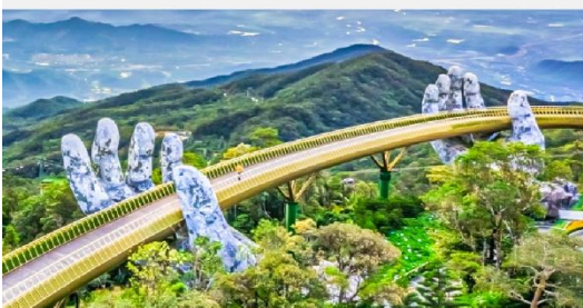
สะพานมือบานาฮิลล์