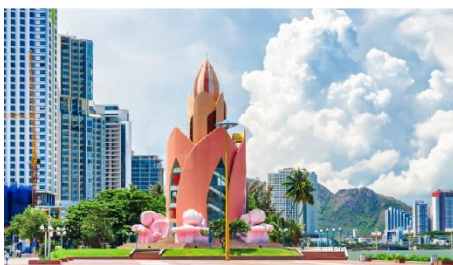
Tram Huong Tower