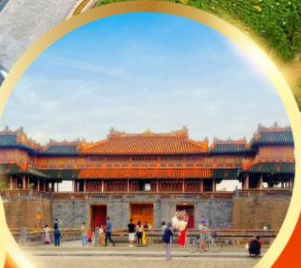
พระราชวังโบราณไดโนย