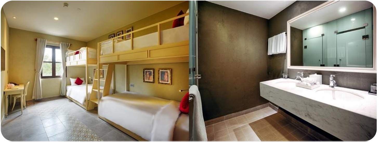
ห้องแบบ Standard Rooms