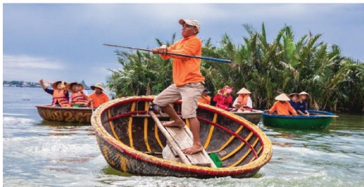
เรือกระดง