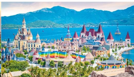
VinWonders NHA TRANG