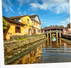
เมืองโบราณฮอยอัน