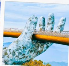
บาน่าฮิลล์