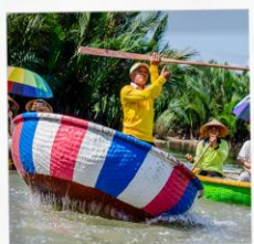
เรือกระดัง