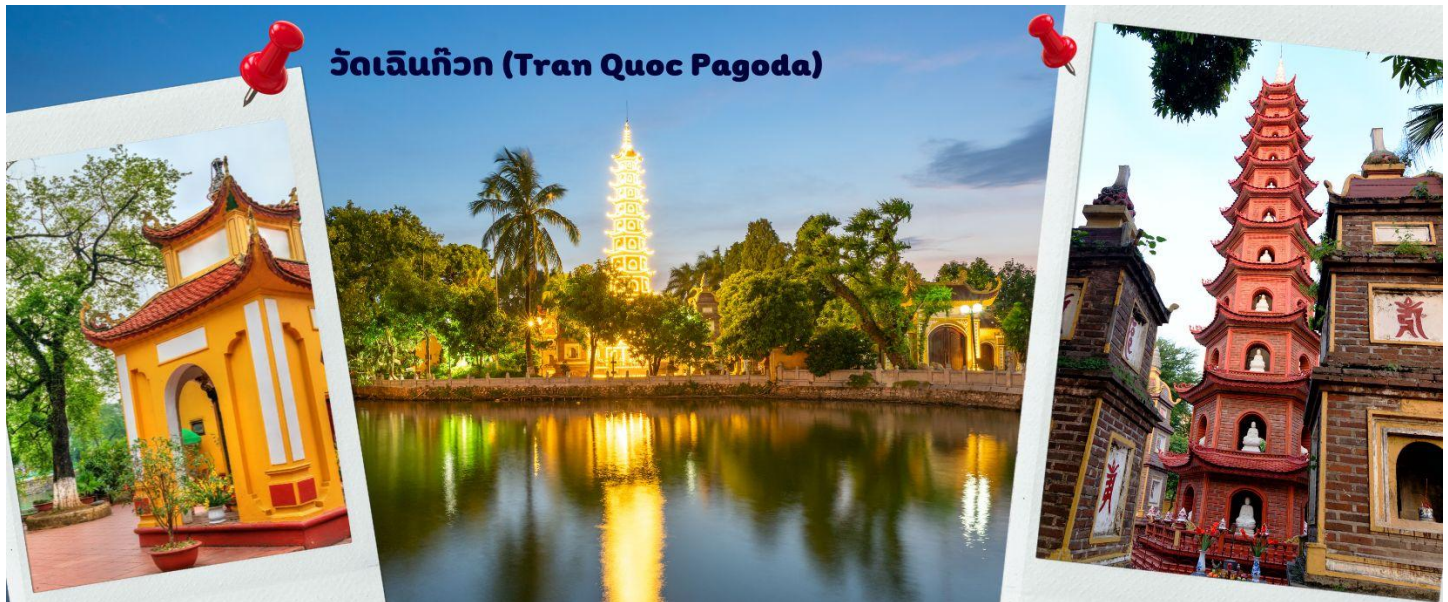
วัดเจินก๊วก (Tran Quoc Pagoda)

จากนั้นนำท่านไป วัดเจินก๊วก (Tran Quoc Pagoda) เป็นวัดที่อยู่ใจกลางเมืองของเวียดนามใกล้ชิดกับทะเลสาบตะวันตกของเมืองฮานอย สร้างด้วยสถาปัตยกรรมจีนโบราณ มีความร่มรื่น และบรรยากาศดี จึงเป็นที่นิยมของนักท่องเที่ยวทั้งที่ชื่นชอบความงามและมีศรัทธาในพระพุทธศาสนาจากภาพมุมสูงของสถานที่ตั้งที่นี่เหมือนตั้งอยู่บนเกาะที่ยื่นลงไปทะเลสาบแต่มีเส้นทางคมนาคมเข้าถึงที่สิ่งปลูกสร้างมีการวางผังเป็นอย่างดี ใช้สีสันทึกลับมกสีในโทนสีเหลือง น้ำตาล ตัดกับสีเขียวของต้นไม้ใหญ่ที่โอบล้อมอยู่ ในมุมถ่ายภาพจากอีกฝั่งหนึ่ง จะเห็นสิ่งปลูกสร้างสไตล์จีน และเจดีย์หลายชั้นโดดเด่น มีภาพที่สะท้อนลงสู่ผืนน้ำเป็นภูมิทัศน์ที่งดงามทั้งยามกลางวันและยามค่ำคืนที่มีการเปิดไฟส่องสว่าง