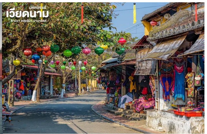
มหัศจรรย์ เวียดนาม ดานัง • ฮอยอัน • บานาอีลส์