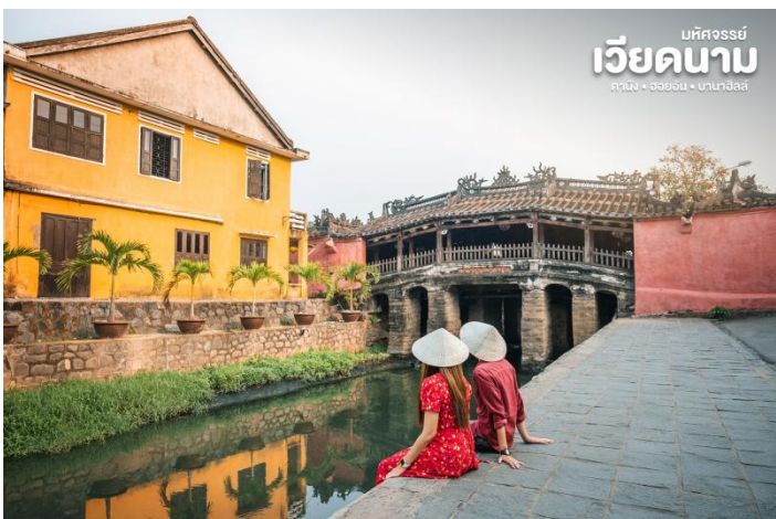
มหัศจรรย์ เวียดนาม ดานัง • ฮอยอัน • บานาอีลส์

นำชม Old House of Tan Sky บ้านโบราณ ซึ่งเป็นชื่อเจ้าของบ้านเดิมชาวเวียดนามที่มีฐานะดี ชมบ้านไม้ที่เก่าแก่และสวยงามที่สุดของเมืองฮอยอัน สร้างมากกว่า 200 ปี ปัจจุบันได้รับการอนุรักษ์ไว้เป็นอย่างดี และยังเป็นที่อยู่อาศัยของทายาทรุ่นที่เจ็ดของตระกูล การออกแบบตัวอาคารเป็นการผสมผสานระหว่างอิทธิพลทางสถาปัตยกรรมของจีน ญี่ปุ่น และเวียดนาม ด้านหน้าอาคารติดถนน เหวียนไทฮ็อกทำเป็นร้านบูติก ด้านหลังติดถนนอีกสายหนึ่งใกล้แม่น้ำทูโบนมีประตูออกไม้ สามารถชมวิวทิวทัศน์และเห็นเรือพายสัญจรไปมาในแม่น้ำทูโบนได้เป็นอย่างดี