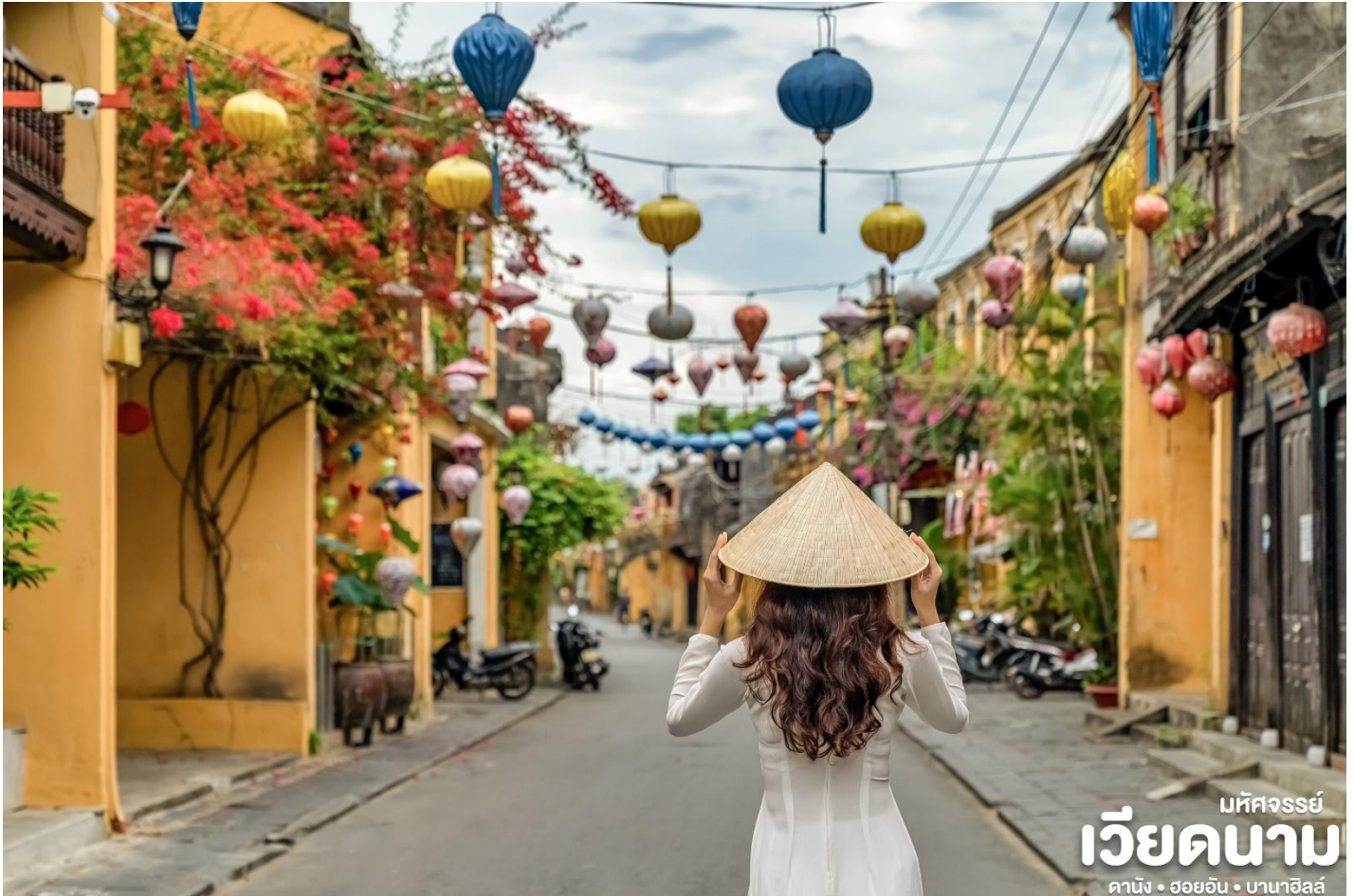
มหัศจรรย์ เวียดนาม ดานัง • ฮอยอัน • บานาอีลส์

นำชม Old House of Tan Sky บ้านโบราณ ซึ่งเป็นชื่อเจ้าของบ้านเดิมชาวเวียดนามที่มีฐานะดี ชมบ้านไม้ที่เก่าแก่และสวยงามที่สุดของเมืองฮอยอัน สร้างมากกว่า 200 ปี ปัจจุบันได้รับการอนุรักษ์ไว้เป็นอย่างดี และยังเป็นที่อยู่อาศัยของทายาทรุ่นที่เจ็ดของตระกูล การออกแบบตัวอาคารเป็นการผสมผสานระหว่างอิทธิพลทางสถาปัตยกรรมของจีน ญี่ปุ่น และเวียดนาม ด้านหน้าอาคารติดถนน เหวียนไทฮ็อกทำเป็นร้านบูติก ด้านหลังติดถนนอีกสายหนึ่งใกล้แม่น้ำทูโบนมีประตูออกไม้ สามารถชมวิวทิวทัศน์และเห็นเรือพายสัญจรไปมาในแม่น้ำทูโบนได้เป็นอย่างดี