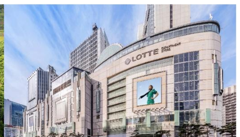
Lotte Center Hanoi