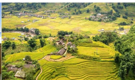
หมู่บ้านต้าฟาน