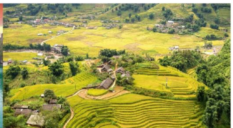
หมู่บ้านต้าฟาน

*กรณีห้องพักรับมาอีลลเต็ม ขอสงวนสิทธิ์ในการเปลี่ยนวันเข้าพัก และปรับเปลี่ยนโปรแกรมโดยคำนึงถึงผลประโยชน์ลูกค้าเป็นสำคัญ