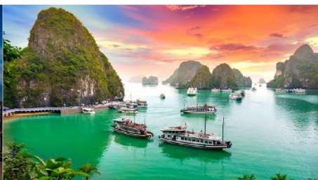
ล่องเรือชมอ่าวฮาลอง