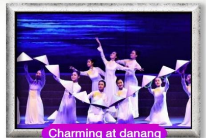
Charming at danang