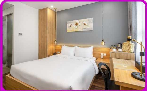
พักเมืองดานัง 4 ดาว 2 คืน