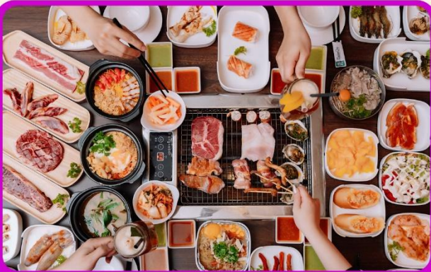
พิเศษ!! เมนูซาซิมิ+บุฟเฟ่ต์ปิ้งย่าง