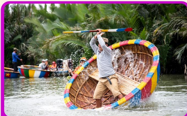
พิเศษ !!! นั่งเรือกระดัง UNSEEN เวียดนาม