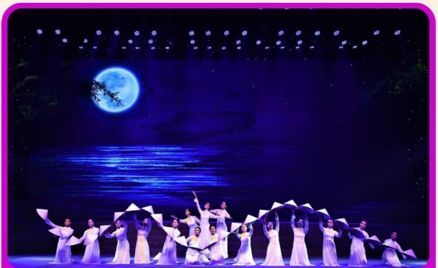
ชมการแสดง Charming Show Danang