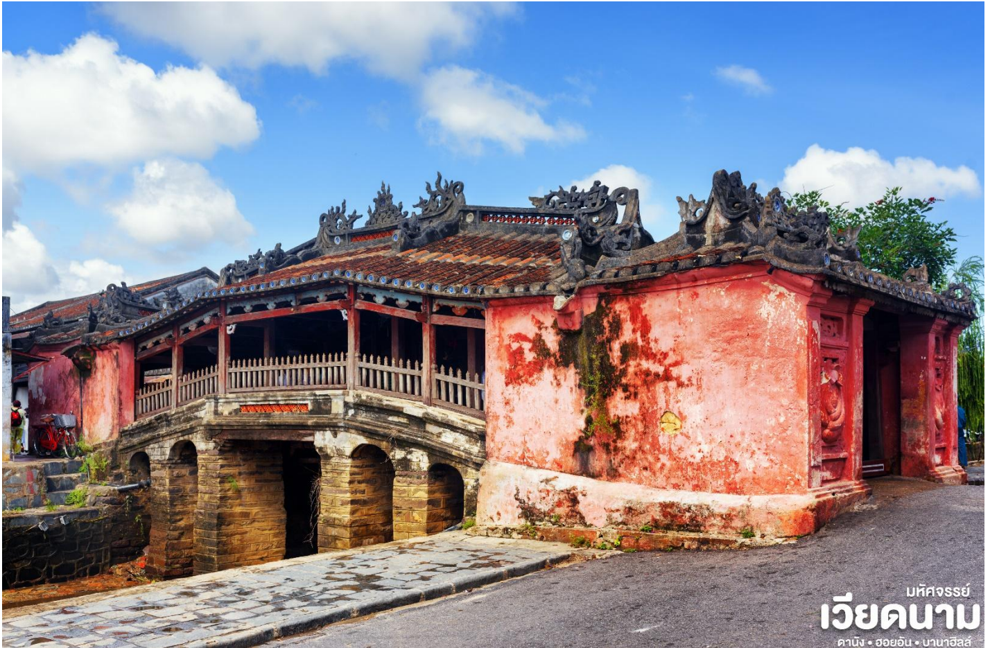
มหัศจรรย์ เวียดนาม ดานัง • ฮอยอัน • บานาฮิลล์

เย็น ๑๑ บริการอาหารเย็น ณ ร้านอาหาร ที่พัก เข้าสู่ที่พัก MAGNOLIA 4* หรือเทียบเท่ามาตรฐานเวียดนาม (โรงแรมที่ระบุในรายการทัวร์เป็นเพียงโรงแรมที่นำเสนอเบื้องต้นเท่านั้นซึ่งอาจมีการเปลี่ยนแปลงแต่โรงแรมที่เข้าพักจะเป็นโรงแรมระดับเทียบเท่ากัน)