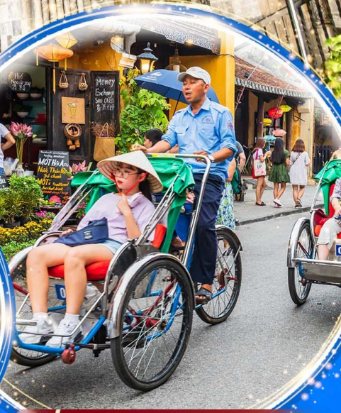
นั่งรถสามล้อซีโคล

พักผ่อน บานาฮิลล์ 1 คืน นั่งกระเช้าที่ยาวที่สุดในโลก ขึ้นสู่บานาฮิลล์ ชมเมือง ฮอยอัน เมืองมรดกโลกที่สวยงามและเจียบสงบ