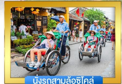
นั่งรถสามล้อชิโคล์