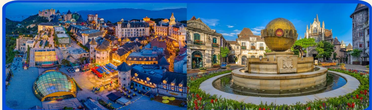
พักผ่อนบานาฮิลล์ 1 คืน