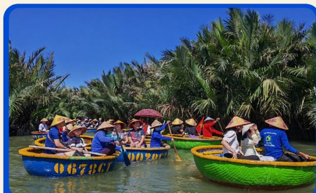
พิเศษ !!! นั่งเรือกระด้ง UNSEEN เวียดนาม