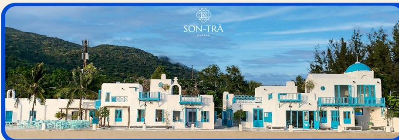
เช็คอินคาเฟ่ SON TRA MARINA