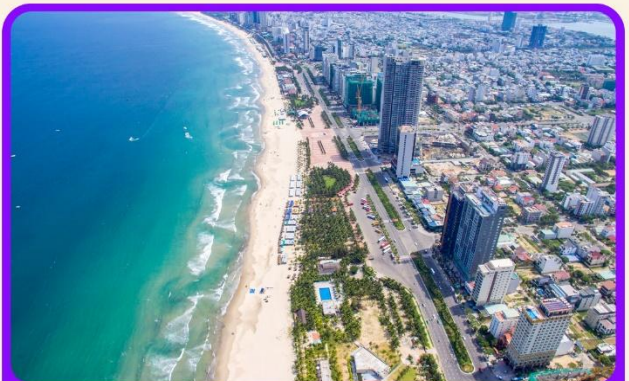
เช็किन ชายหาดหมีเคว เป็นชายหาดที่สวยงามที่สุดในเมืองดานัง