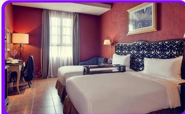
พักบนบานาฮิลล์ 1 คืน