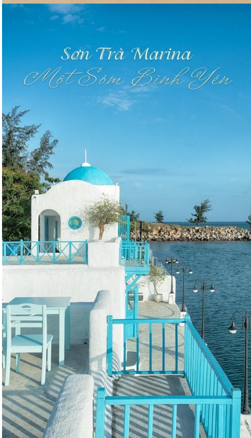
Son Tra Marina Môt Sôm Bỉnh Yên