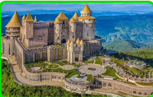
เที่ยวบานาฮิลล์แบบจุใจ เต็มวัน