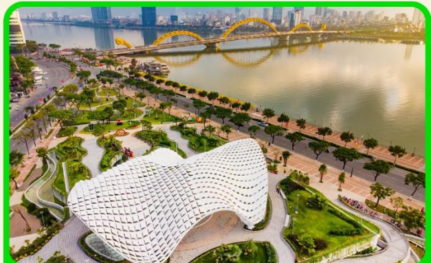
เช็किन แหล่งที่เที่ยงใหม่ APEC PARK