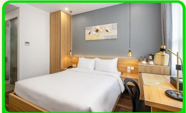
พักเมืองดานัง 4 ดาว 3 คืน