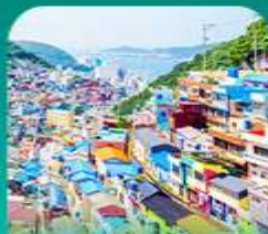
หมู่บ้านคิมซอน