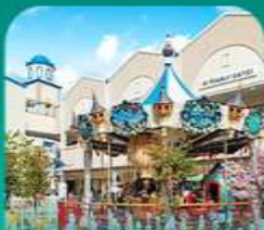
ค็องต๊อ เจ้ากิลัด