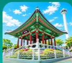
สวนแข่งดูซาน