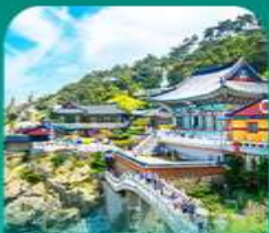
วัดแฮดงกุงซา

เที่ยวปูซานแบบแกรนด์ แกรนด์ ทั้งสายอาร์ท สายบู และสายช้อปปิ้ง • เช็กอินบนท่าอูรูปสุดคูลเลอร์ฟล ที่ท่าเรือจินบี (BUSAN BUNEZIA) เคนเล่นหมู่บ้านคิมซอน ซานโดรมแห่งปูซานสุดน่ารัก พลาดไม่ได้กับการนั่งรถไฟปูซาน ชมวิวทะเลเมืองปูซาน • เสริมสิริมงคลที่วัดแฮดงกุงซา วัดริมทะเลชื่อดัง พร้อมช้อปปิ้งที่ตลาดคิพรีนียบเจ้ากิลัด และตลาดนัมโพดง ก่อนปิดท้ายด้วย ย่านวีอรัมสุดชิค ซอ มยอง อตนิว พร้อมชมวิวสะพาน กวังอินยามค่าค้นสุดโรแมนติก