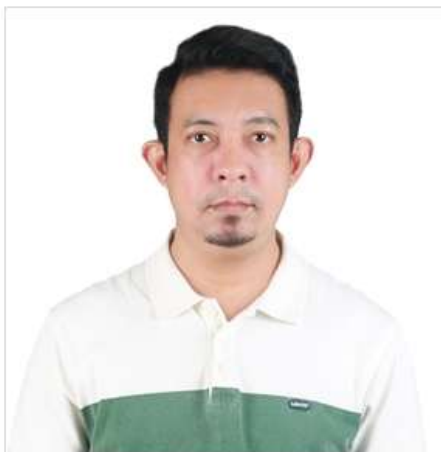
( ตัวอย่างรูปถ่าย )