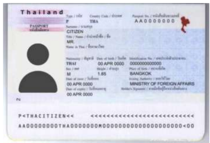
( ตัวอย่างถ่ายหน้าพาสปอร์ต )