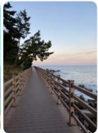
จัดเทศกาลดนตรีชายหาดเกือบตลอดทั้งปี