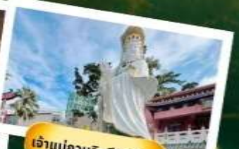
เจ้าแม่กวนอิมริพัลส์เบย์