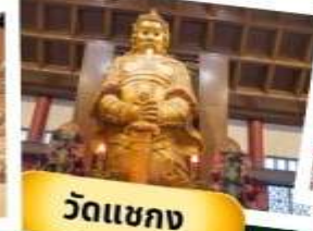
วัดเขากง