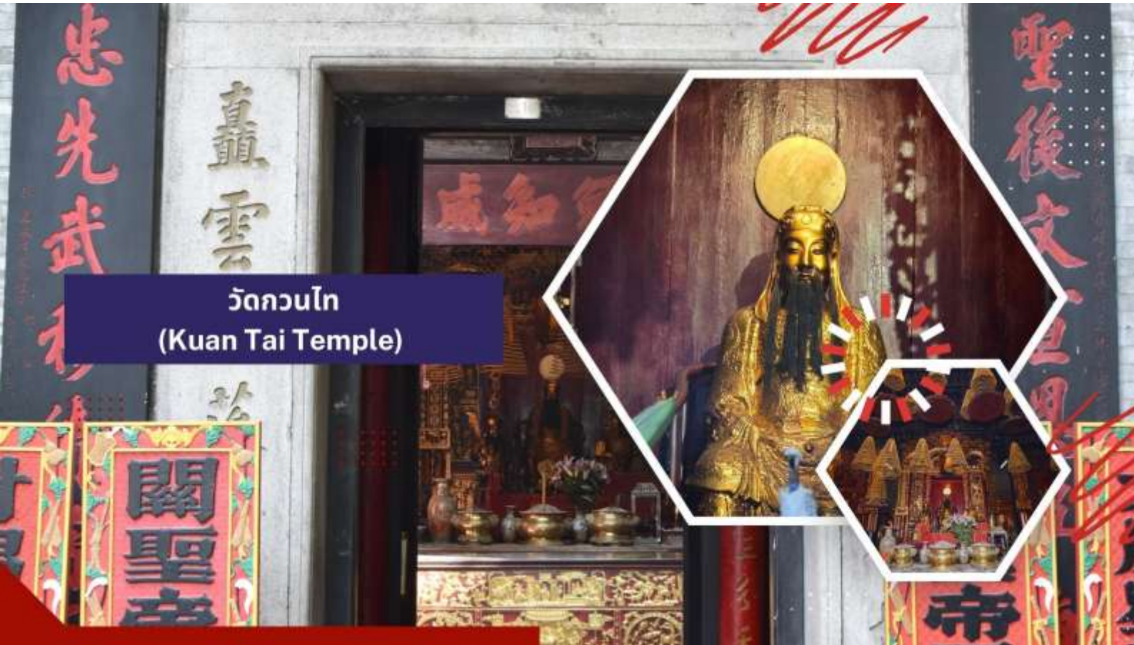
วัดกวนไท (Kuan Tai Temple)

นำท่านเดินทางสู่ วัดกวนไท (Kuan Tai Temple) หรือรู้จักกันในชื่อ วัดชำไถ่กุยคุน (Sam Kai Vui Kun Temple) เป็นวัดที่มีความสำคัญทางประวัติศาสตร์และวัฒนธรรมในมาเก๊า ได้รับการขึ้นทะเบียนเป็นมรดกโลกของ UNESCO ร่วมกับศูนย์กลางประวัติศาสตร์มาเก๊าในปี ค.ศ. 2005 เนื่องจากคุณค่าทางประวัติศาสตร์ สถาปัตยกรรม และวัฒนธรรมที่โดดเด่น ตั้งอยู่ใจกลางจัตุรัสเซนาโดและรายล้อมไปด้วยอาคารสไตล์ยุโรป วัดนี้สร้างขึ้นเมื่อปี ค.ศ. 1750 และเป็นที่ประดิษฐานของเทพเจ้ากวนอู ซึ่งเป็นเทพเจ้าแห่งความมั่งคั่งและปกป้องคุ้มครอง วัดแห่งนี้มีเป็นที่นิยมของผู้ทำธุรกิจ ตำรวจ และนักการเมือง เพราะเชื่อว่าสามารถปกป้องสิ่งชั่วร้ายต่างๆ และช่วยเสริมอำนาจบาปในการปกครองและคุ้มครองบริวาร