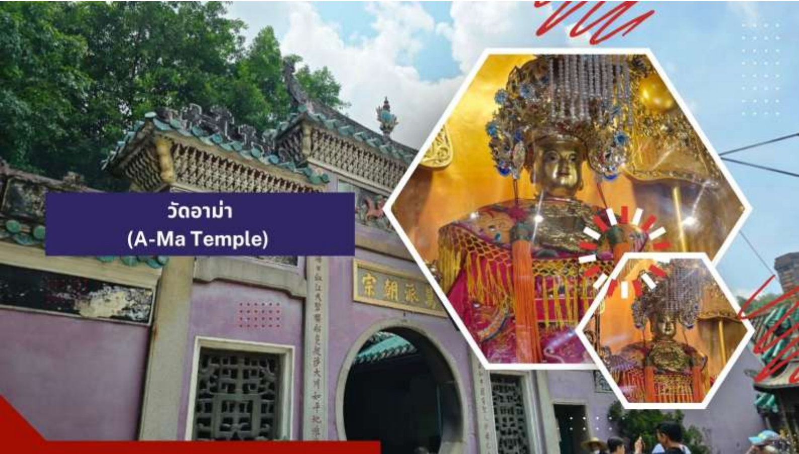
วัดอาม่า (A-Ma Temple)

นำท่านเดินทางสู่ วัดอาม่า (A-Ma Temple) ให้ทุกท่านได้กราบไหว้เจ้าแม่ทับทิม ซึ่งเป็นวัดที่มีชื่อเสียงมากๆ สำหรับวัดแห่งนี้ตั้งอยู่ ใกล้กับทะเล ภายในวัดดูแล้วก็แปลกตาดีเพราะว่ามีการก่อสร้างกันแบบลัดหล่นกันไปตามพื้นที่ที่อำนวย เนื่องจากสถานที่แห่งนี้ตั้งอยู่ริมเชิงเขา เมื่อเดินพันซุ่มประตูก็จะพบกับศาลของเจ้าแม่ทับทิมตั้งอยู่นอกจากนั้นก็ยังมี หอเมตตาธรรม ศาลเจ้าแม่กวนอิม ศาลพุทธจีนเจ้าชานหลินและยังมีศาลเจ้าขนาดเล็กๆ อีกหลายศาลที่ได้มีการสร้างเพื่อถวายให้แก่เจ้าแม่ทับทิม