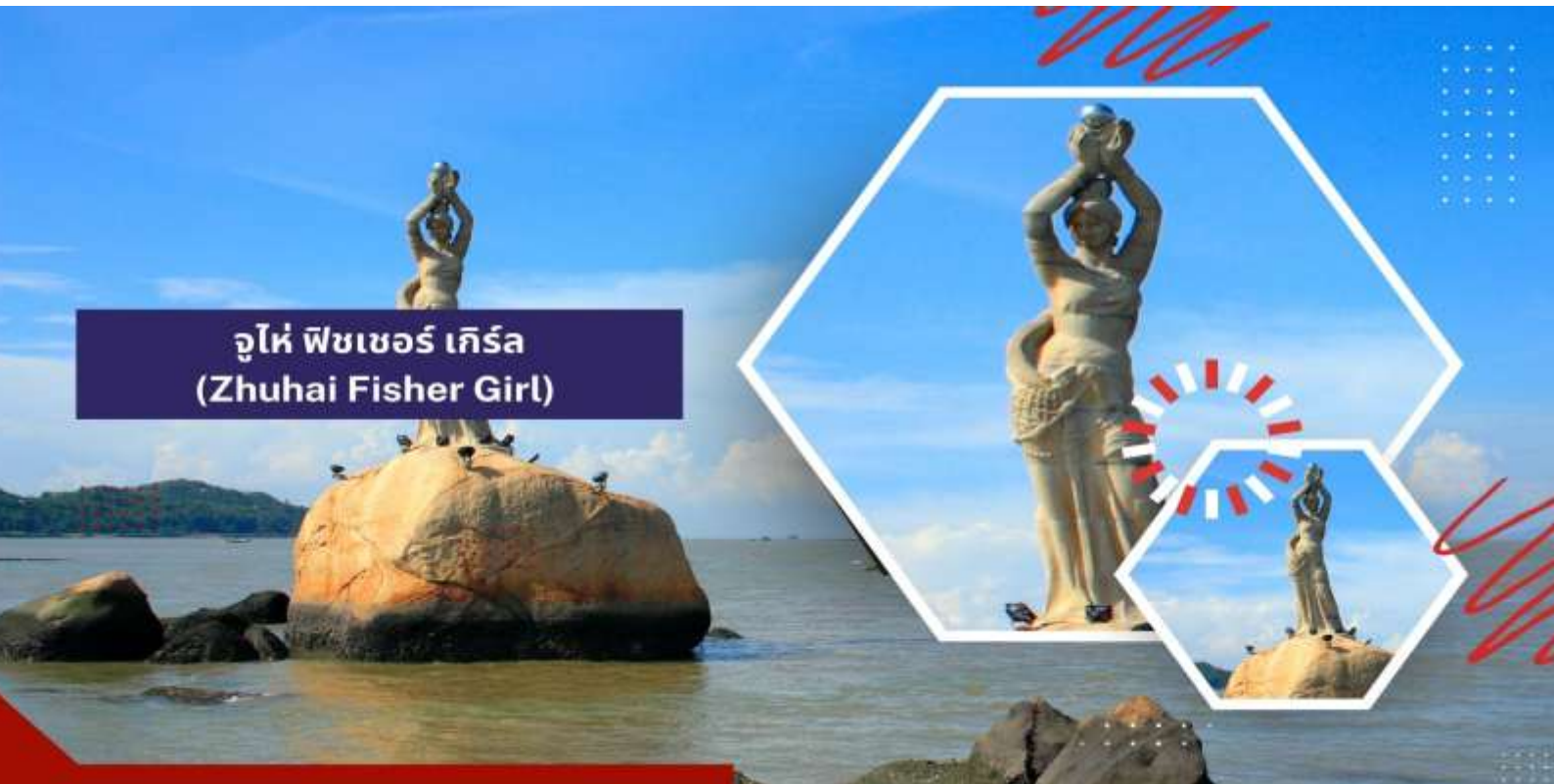
จูไห่ ฟิชเชอร์ เกิร์ล (Zhuhai Fisher Girl)

นำท่านชม จูไห่ ฟิชเชอร์ เกิร์ล (Zhuhai Fisher Girl) สัญลักษณ์อันสวยงามโดดเด่นของเมืองจูไห่ หรือมีอีกชื่อเรียกว่า “หวีหนี่” ตั้งอยู่บริเวณอ่าวเซียงหู เป็นรูปปั้นสาวงามยืนถือไข่มุกอยู่ริมทะเล ซึ่งเป็นลักษณะบ่งบอกถึงความสงบสุข ความอุดมสมบูรณ์รุ่งเรืองแห่งเมืองจูไห่นั้นเอง