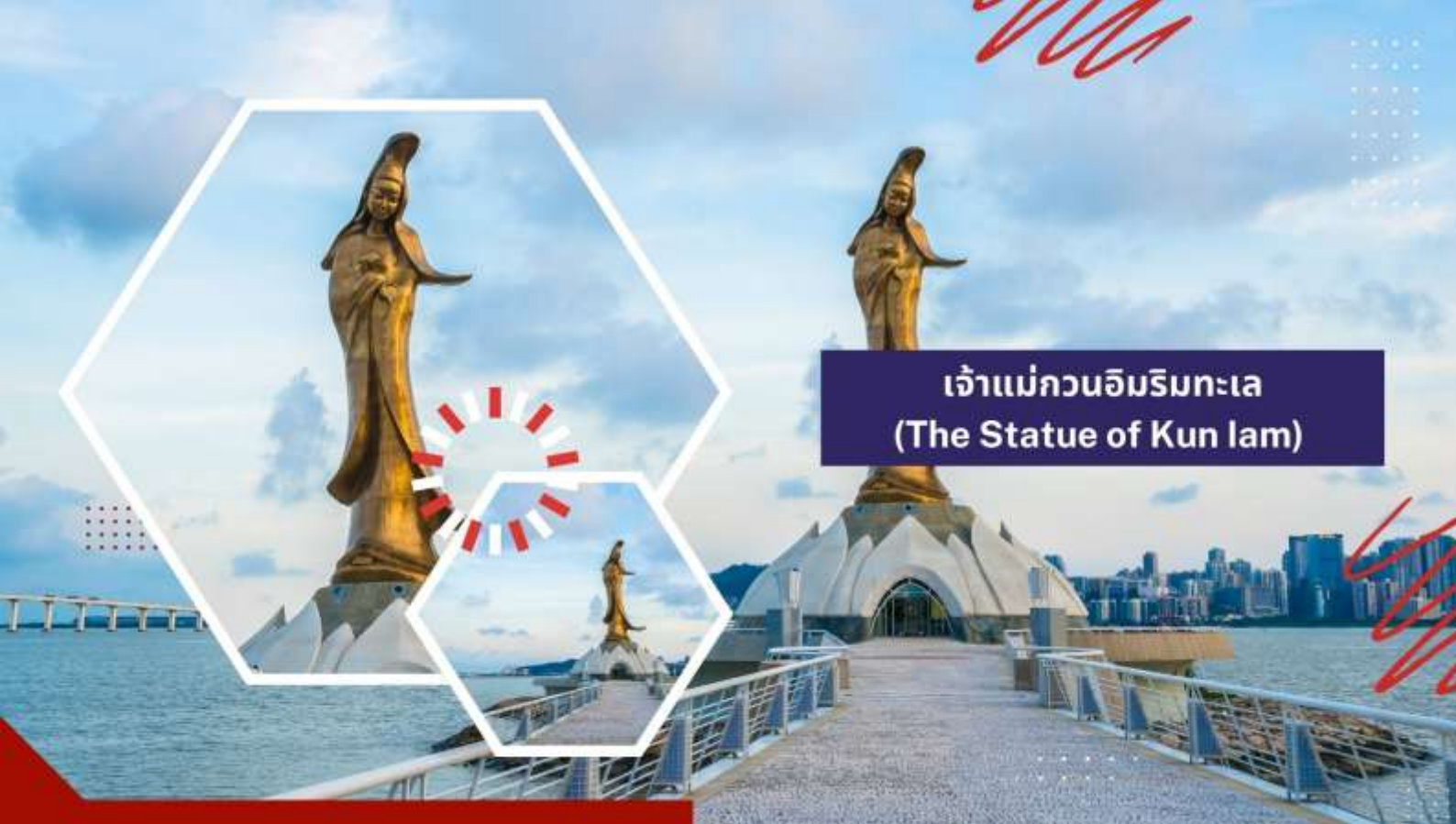
เจ้าแม่กวนอิมริมทะเล (The Statue of Kun lam)

นำท่านชม เจ้าแม่กวนอิมริมทะเล (The Statue of Kun lam) เจ้าแม่กวนอิมปรางค์ทองสร้างด้วยทองสัมฤทธิ์ทั้งองค์ มีความสูง 18 เมตร หนักกว่า 1.8 ตัน ประดิษฐานอยู่บนฐานดอกบัวงดงามอ่อนช้อย สะท้อนกับแดดเป็นประกายเรืองรองเหลืองอร่ามดงาม จับตา เจ้าแม่กวนอิมองค์นี้เป็นเจ้าแม่กวนอิมลูกครึ่ง คือ ปั้นเป็นองค์เจ้าแม่กวนอิมแต่กลับมีพระพักตร์เป็นหน้าพระแม่มาลีที่เป็นเช่นนี้ก็เพราะว่าเป็นเจ้าแม่กวนอิมไปตุเกสตั้งใจสร้างขึ้นเพื่อเป็นอนุสรณ์ให้กับมาเก๊าในโอกาสที่ส่งมอบมาเก๊าคืนให้กับจีน