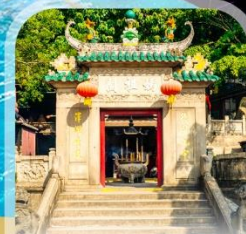
วัดตาม่า