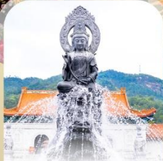
วัดพุทไธ

✈️ คอนเฟิร์ม ออกเดินทาง ทุกปีเรียด 2 ท่านขึ้นไป