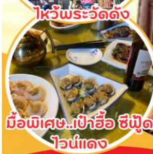
มือพิเศษ...เป่าฮ้อ ซิฟู๊ด ไวน์แดง