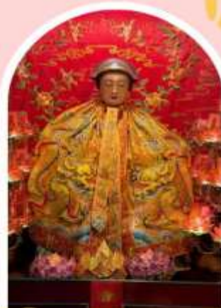
วัดหลังโหมว

ความสำเร็จ ความมั่งคั่ง เงินทองไหลมาเทมา