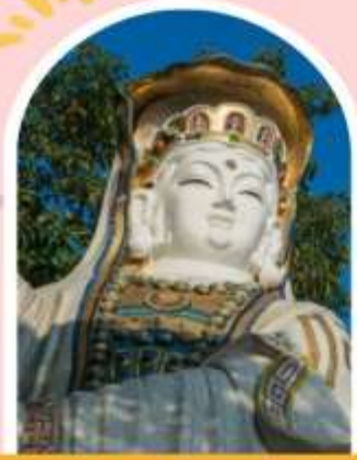
ริพลัสเบย์