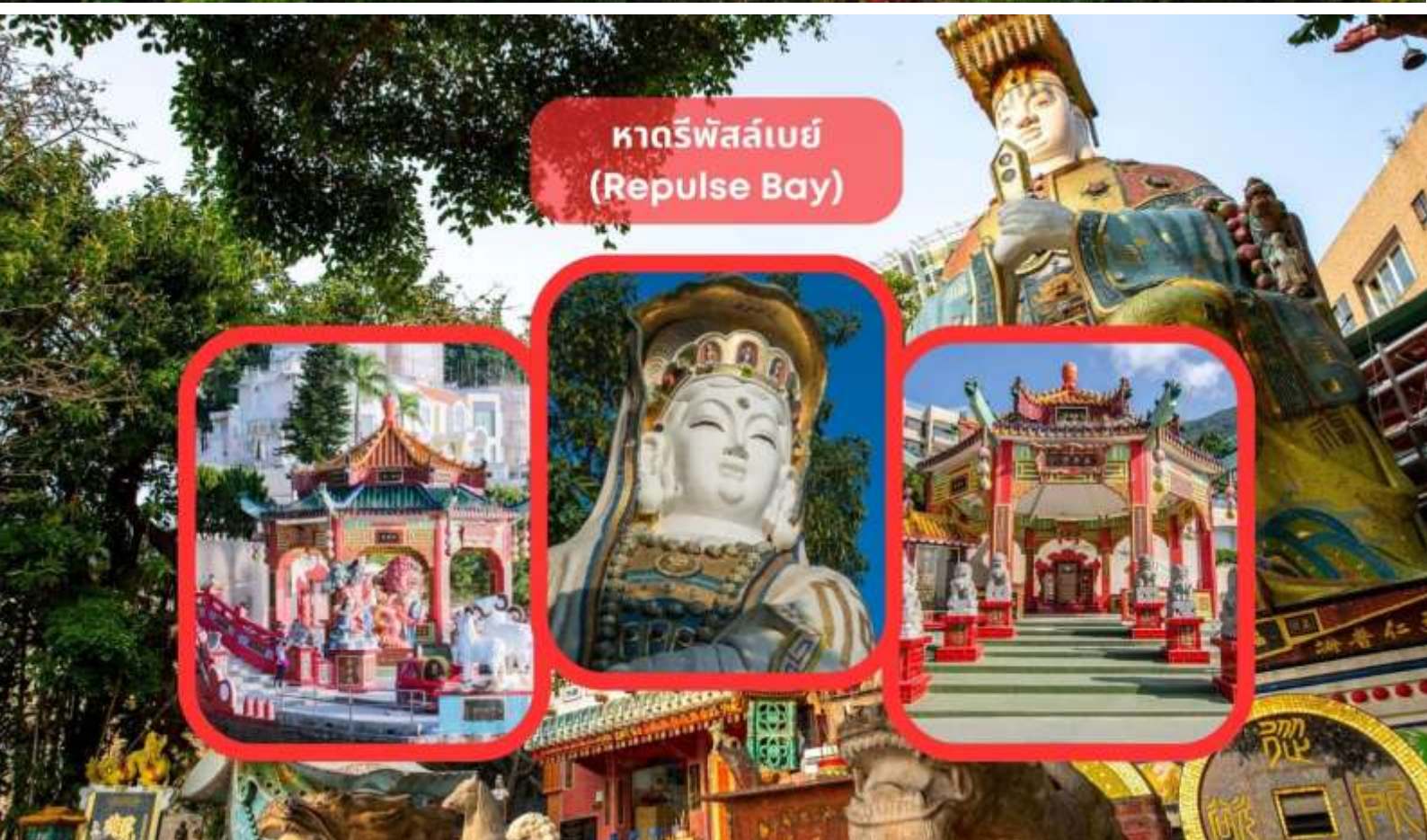
หาดรีพัลส์เบย์ (Repulse Bay)

นับถืออย่างมาก ไม่ว่าจะขอพรสิ่งใดก็จะสมความปรารถนาทั้งสิ้น เริ่มต้นด้วยการ เดินเข้าวัดด้วยเท้าซ้าย และออกด้วยเท้าขวา เป็นเคล็ดลับที่ชาวฮ่องกง และคนจีนบอกว่าคล้ายกับการเดินของเข้มนาฬิกา ซึ่งจะทำให้ชีวิตเจริญก้าวหน้า