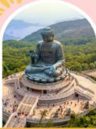
นั่งกระเชานองปิง