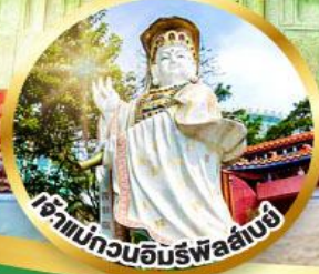
ขอพรรับพลังงานดี เสริมพลังของขวัญ