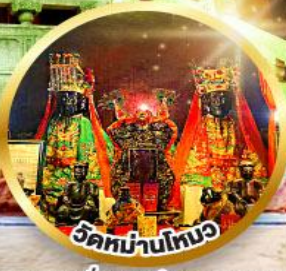
ขอพรเรื่องการศึกษา, การงาน สติปัญญาและความกล้าหาญ