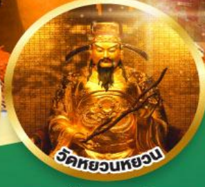
ขอพรเรื่องสุขภาพ, โชคลาภ ความเจริญก้าวหน้า

เมนูพิเศษ! ต้มซ่าฮ่องกง, บุฟเฟต์ซาบูสไตล์ฮ่องกง, ห่านย่าง