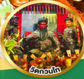
ขอพรเทพเจ้ากวนอู เงินทอง, ธุรกิจมั่นคง