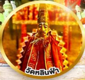
ขอพรเสริมโชคลาภในธุรกิจ และการเงิน