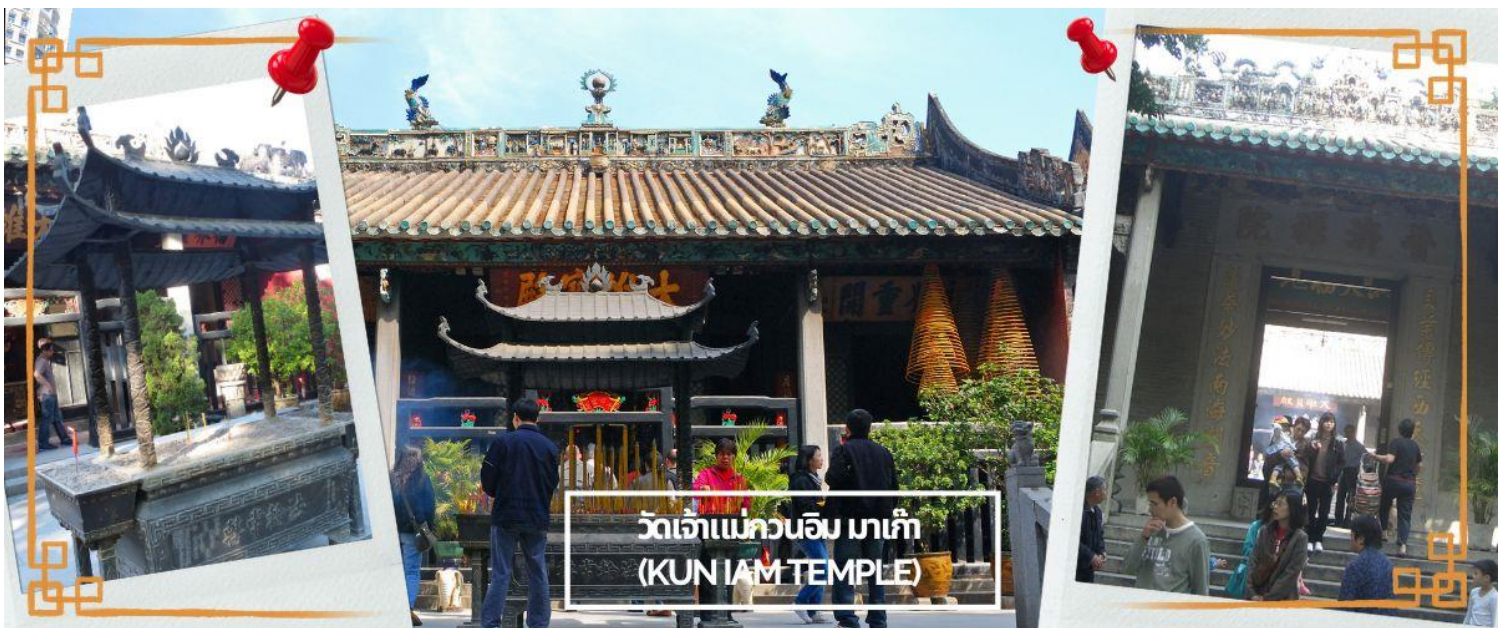
วัดเจ้าแม่กวนอิม มาเก๊า (KUNIAM TEMPLE)

นำท่านเดินทางสู่ วัดเจ้าแม่กวนอิม มาเก๊า (Kun lam Temple) เป็นหนึ่งในสามวัดเก่าแก่ที่สุดของมาเก๊า ถูกสร้างขึ้นระหว่างการครองราชย์ของจักรพรรดิว่านลี่ ในสมัยราชวงศ์หมิง ภายในเป็นที่ประดิษฐานของเทพเจ้าหลายองค์ รวมถึงองค์ที่มีชื่อเสียง นั่นก็คือ เจ้าแม่กวนอิม ซึ่งไม่เหมือนที่ไหนด้วยการแต่งเครื่องทรงชุดเจ้าสาวโบราณอย่างสวยงาม ผู้คนนิยมมาไหว้ขอพรให้มีความสุขและโชคดี รวมถึงการทำพิธีศักดิ์สิทธิ์เสริมสิริมงคลเรื่องเงินทอง สำหรับพิธีศักดิ์สิทธิ์ที่เรียกว่า “วันเปิดทรัพย์” เป็นพิธียิ่งใหญ่ประจำปีที่จะประกอบ พิธียืมเงินเจ้าแม่กวนอิม ซึ่งในหนึ่งปีจะมีฤกษ์ดีเพียงปีละครั้งเท่านั้น แต่ละปีอาจจะวันที่ไม่ตรงกัน โดยจะมีการคำนวณจากวันเวลาตามปฏิทินจีน ปกติแล้วฤกษ์