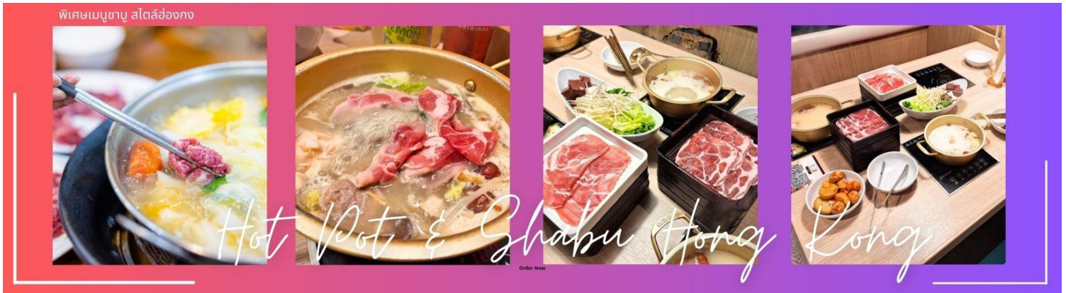
กลางวัน ๑๐ บริการอาหารกลางวัน ณ ภัตตาคาร พิเศษ เมนูชาบู สไตล์ฮ่องกง (6)

จากนั้นนำท่านชม โรงงานจิวเวอรี่ ซึ่งเป็นโรงงานที่มีชื่อเสียงที่สุดของฮ่องกงในเรื่องการออกแบบเครื่องประดับ อาทิเช่น จี้ และแหวนกัณฑ์ ที่สวยงามโดดเด่นไม่เหมือนใคร ซึ่งถือกำเนิดขึ้นที่นี่และมีชื่อเสียงที่สุดใช้เป็นเครื่องประดับติดตัว และเสริมดวงชะตา สินค้าทุกชิ้นมีเอกสารรับประกันคุณภาพเปลี่ยน ซ่อม ได้ตลอดอายุการใช้งาน หากเกิดการชำรุดจากสินค้าไม่ใช่อุบัติเหตุ และนำท่านเลือกซื้อ เครื่องประดับที่ ร้านหยก ซึ่งคนจีนนั้นถือว่าหยกเป็นหิน ที่เป็นตัวแทนของความสวยงามและความบริสุทธิ์ มีความเชื่อว่าหยกมงคล ถ้าพกติดตัวไว้จะอายุยืนและสุขภาพดี