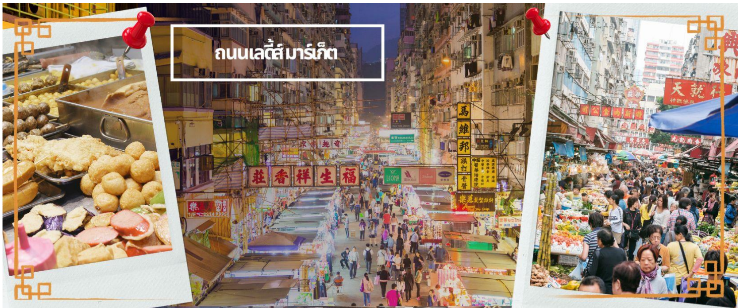
ถนนเลดี้ส์ มาร์เก็ต

จากนั้นนำท่านเดินทางสู่ ย่านมงก๊ก เป็นย่านที่มีความคึกคักที่สุดแห่งหนึ่งในเกาะฮ่องกงก็ว่าได้ เป็นสวรรค์ของนักช้อปปิ้งอีกหนึ่งที่ ที่สายช้อปปะพลาดไม่ได้ นับได้ว่าเป็นย่านช้อปปิ้งที่คึกคักมากอีกแห่งหนึ่งของฮ่องกงเพราะเป็นย่านช้อปปิ้งที่มีทั้งร้านค้า และคนที่มาช้อปปิ้งจากที่ต่างๆ มากมายไม่ขาดสายตั้งแต่กลางวันยันกลางคืน เป็นถนนช้อปปิ้งที่มีสีสันมาก ถ้าเทียบกับญี่ปุ่นแล้วก็เปรียบเหมือนการเดินทางอยู่ที่ชิบูย่าเลยก็ว่าได้ และยังมี ถนนเลดี้ส์ มาร์เก็ต (LADIES MARKET) ที่มีทั้งเครื่องสำอาง เสื้อผ้า รองเท้า กระเป๋า เครื่องประดับมากมายให้เลือกช้อป อีกทั้งยังมีร้านอาหารและเครื่องดื่ม ที่