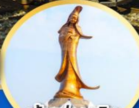
เจ้าแม่กวนอิม ริมทะเลมาเก๊า