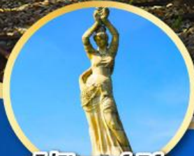
จูไห่ฟิชเชอร์เกิร์ล