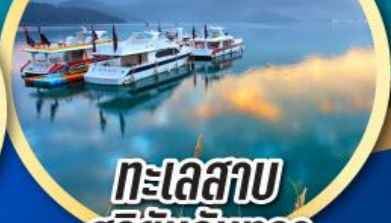
ทะเลสาบ สุริยันจันทรา