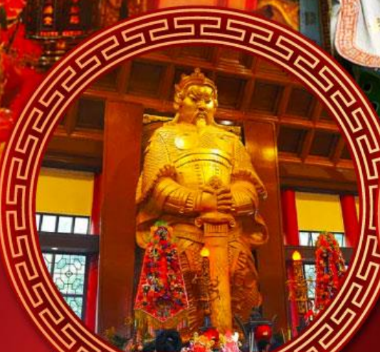
วัดเขกงหมิว