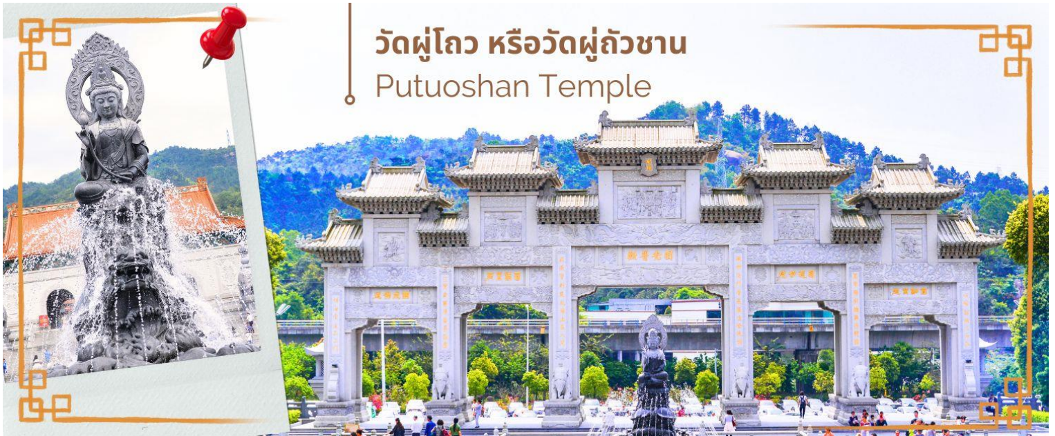
วัดผู้โถว หรือวัดผู้ถัวซาน Putuoshan Temple

จากนั้นนำท่านสู่ วัดผู้โถว หรือวัดผู้ถัวซาน (Putuoshan Temple) ดินแดนอันศักดิ์สิทธิ์ ของพระโพธิสัตว์กวนอิม พุทธศาสนิกายมหายาน พระโพธิสัตว์กวนอิมคืออวตารหนึ่งของพระอมิตาภพุทธเจ้า ซึ่งพระโพธิสัตว์กวนอิมเป็นมหาบุรุษมีวัฒนธรรมโดยรวมกว้างขวางและออกแบบด้วยรูปแบบสถาปัตยกรรมโบราณแบบดั้งเดิม