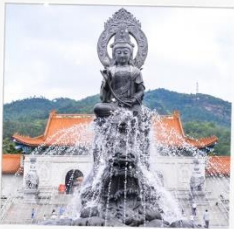
วัดฟูโกว