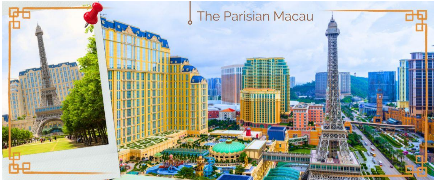
The Parisian Macau

จากนั้นนำท่านสู่ THE VENETIAN โรงแรมหรูในมาเก๊า ภายในมีห้องพักรับรองหลายพันห้อง มีห้องคอมพิวเตอร์ขนาดใหญ่ให้บริการ และมีกาสิโนที่นักพนันและนักท่องเที่ยวระดับไฮโซมาเล่นกันเพื่อความสนุกสนาน มากกว่าเล่นเพื่อผลาญทรัพย์สินเชิงอบายมุข ตลอดจนมีแหล่งจับจ่ายระดับโลกรวมอยู่ในที่เดียวกัน และยังมีเรือกอนโดลาบริการสำหรับผู้ต้องการล่องเรือในบรรยากาศเวนิสจำลองด้วยเช่นกัน ในส่วนที่เป็นตัวตึก ซึ่งเป็นที่ตั้งของโรงแรมและคาสิโนนั้น กินพื้นที่มากถึง 980,000 ตารางเมตร สูง 40 ชั้น ภายในตัวอาคารทั้งหมด ถูกออกแบบตามสไตล์อิตาลีเลียน และที่โดดเด่นที่สุด คือเพดาน ที่วาดลวดลายเอาไว้อย่างวิจิตรงดงาม