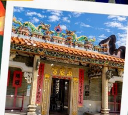
วัดปึกโต