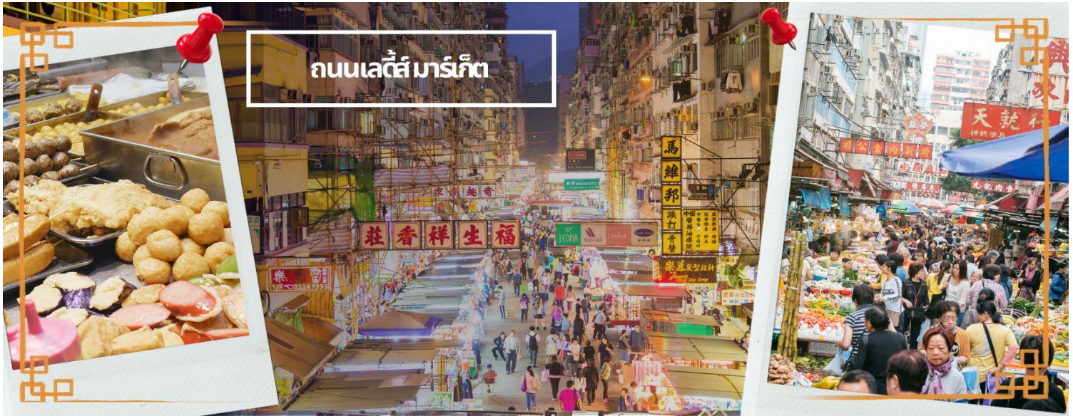
ถนนเลดี้ มาร์เก็ต

สมควรแก่เวลานำคณะออกเดินทางสู่สนามบินฮ่องกง