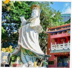
เจ้าแม่กวนอิมธิพลาลัย