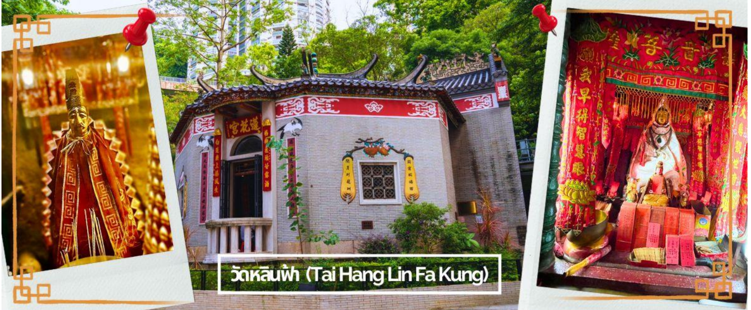
วัดหลินฟา (Tai Hang Lin Fa Kung)

(เทพเจ้าสายนรก) เป็นเทพที่ขึ้นชื่อเรื่องความกตัญญู และด้านเงินทอง ผู้ใดที่ได้ไปไหว้ขอพรท่าน เชื่อว่าจะทำให้มีโชคลาภแบบไม่คาดคิด และสมหวังอย่างรวดเร็ว ใครที่ชอบเสี่ยงโชค เสี่ยงดวง ห้ามพลาดเลยทีเดียว