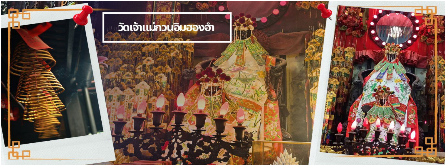
วัดเจ้าแม่ทวนอิมของอำ

จากนั้นนำท่านชม โรงงานจิวเวอรี่ ซึ่งเป็นโรงงานที่มีชื่อเสียงที่สุดของฮ่องกงในเรื่องการออกแบบเครื่องประดับ อาทิเช่น จี้ และแหวนกำหั้น ที่สวยงามโดดเด่นไม่เหมือนใคร ซึ่งถือกำเนิดขึ้นที่นี่และมีชื่อเสียงที่สุดใช้เป็นเครื่องประดับติดตัว และเสริมดวงชะตา สินค้าทุกชิ้นมีเอกสารรับประกันคุณภาพเปลี่ยน ซ่อม ได้ตลอดอายุการใช้