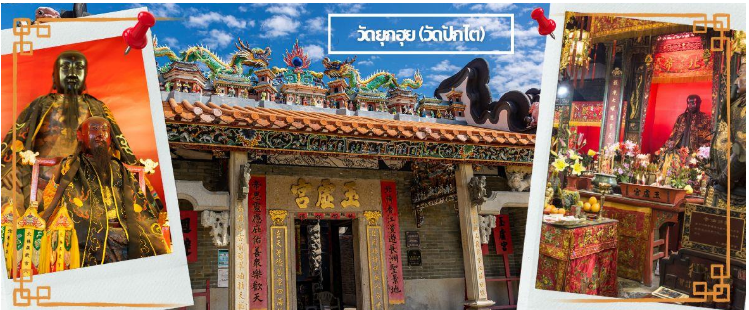
วัดยกุย (วัดปักไต่)

จากนั้นนำท่านเดินทางสู่ วัดปักไต่ เป็นสถานศักดิ์สิทธิ์ที่มีประวัติมายาวนาน 160 ปี ในเขต WAN CHAI เป็นวัดที่บูชาเทพเจ้าแห่งท้องทะเลในลัทธิเต๋า และชาวฮ่องกงเชื่อกันว่าผู้ใดที่เกิดปีชง หากมาทำการแก้ดวงชะตาแก้ชงประจำปีที่วัดนี้ จะทำให้ร้ายกลายเป็นดีได้ และที่วัดยังมี “เทพเจ้าเปลี่ยนใจ” ที่นิยมมาขอพรให้เรื่องที่ไม่ดีกลายเป็นเรื่องดี หรือคนที่ศัตรูของเราเปลี่ยนใจมาเป็นมิตร จึงเป็นที่นิยมอย่างมากของชาวฮ่องกง