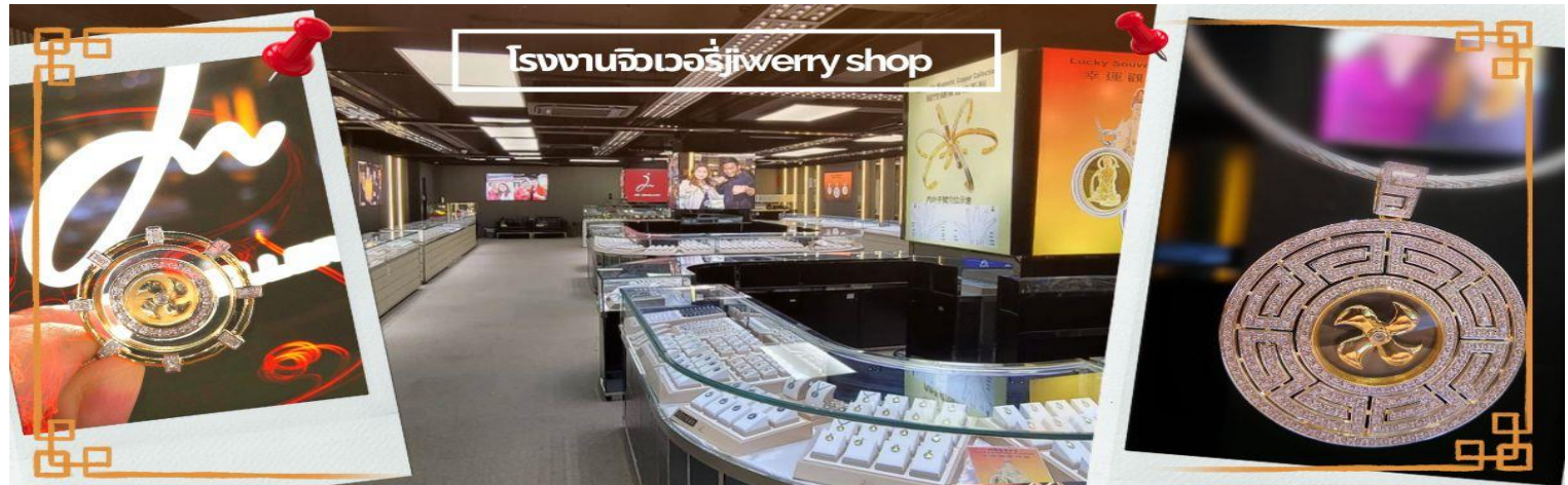
โรงงานจิวเวอรี่jewery shop

จากนั้นนำท่านชม โรงงานจิวเวอรี่ ซึ่งเป็นโรงงานที่มีชื่อเสียงที่สุดของฮ่องกงในเรื่องการออกแบบเครื่องประดับ อาทิเช่น จี้ และแหวนกำหั้น ที่สวยงามโดดเด่นไม่เหมือนใคร ซึ่งถือกำเนิดขึ้นที่นี่และมีชื่อเสียงที่สุดใช้เป็นเครื่องประดับติดตัว และเสริมดวงชะตา สินค้าทุกชิ้นมีเอกสารรับประกันคุณภาพเปลี่ยน ซ่อม ได้ตลอดอายุการใช้